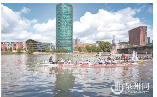
5月25日,在德國法蘭克福,龍舟隊伍在美因河上參加比賽。

泉州網訊(融媒體記者張素萍 通訊員肖晔 文/圖)近日,一艘22人制“泉州號”龍舟,不遠萬里抵達德國法蘭克福美因