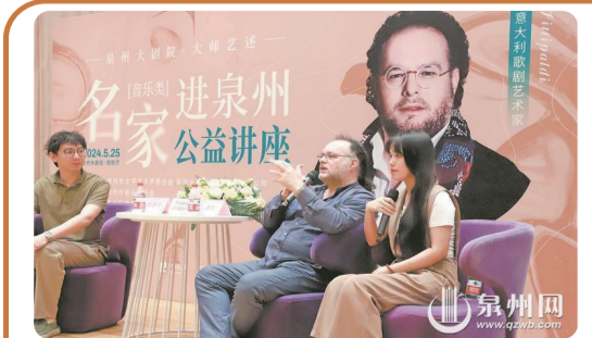
意大利歌劇藝術家公益講座現場

泉州網訊(融媒體記者陳智勇)日前,“名家進泉州公益講座”(音樂類)在泉州大劇院舉行,意大利歌劇藝術家弗朗西斯科·津加裏埃洛到場分享,詳解聲樂技法和歌劇演唱藝術,還一對一進行指導,讓現場聲樂教師、音樂愛好者受益匪淺。