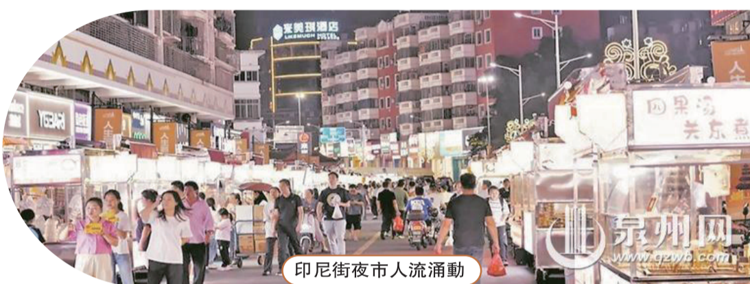
印尼街夜市人流涌動

原來,洛江通過施行“托管運營”模式,即以街道市場辦為監督管理主體、第三方承租為營銷運行主體、個體經營戶為制作銷售主體的模式,第三方營銷運行主體負責對入駐攤位按照“三有三統一”(有攤位